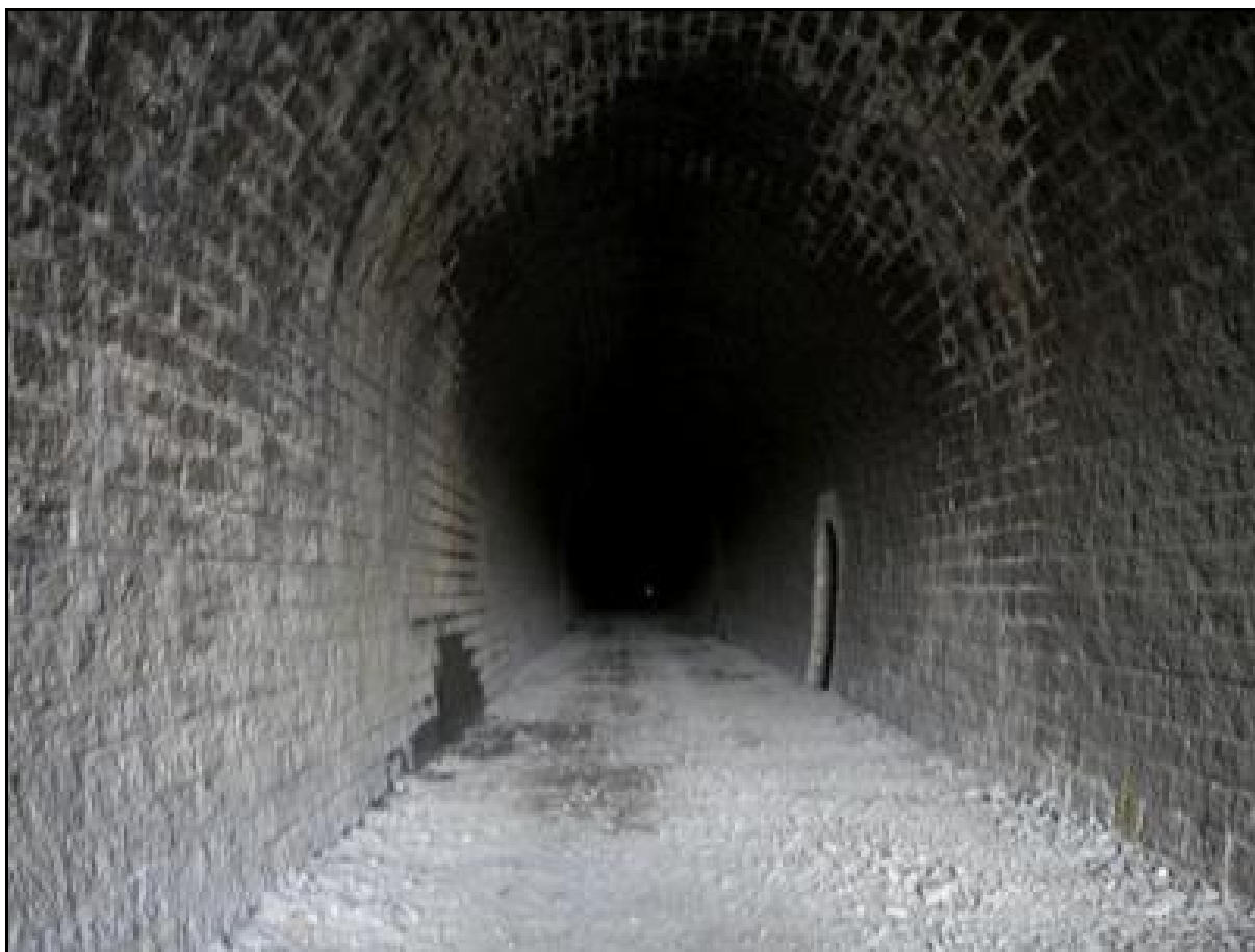
La galerie vue depuis la sortie

Si cette fiche comporte des erreurs ou des oublis, merci de nous le signaler.