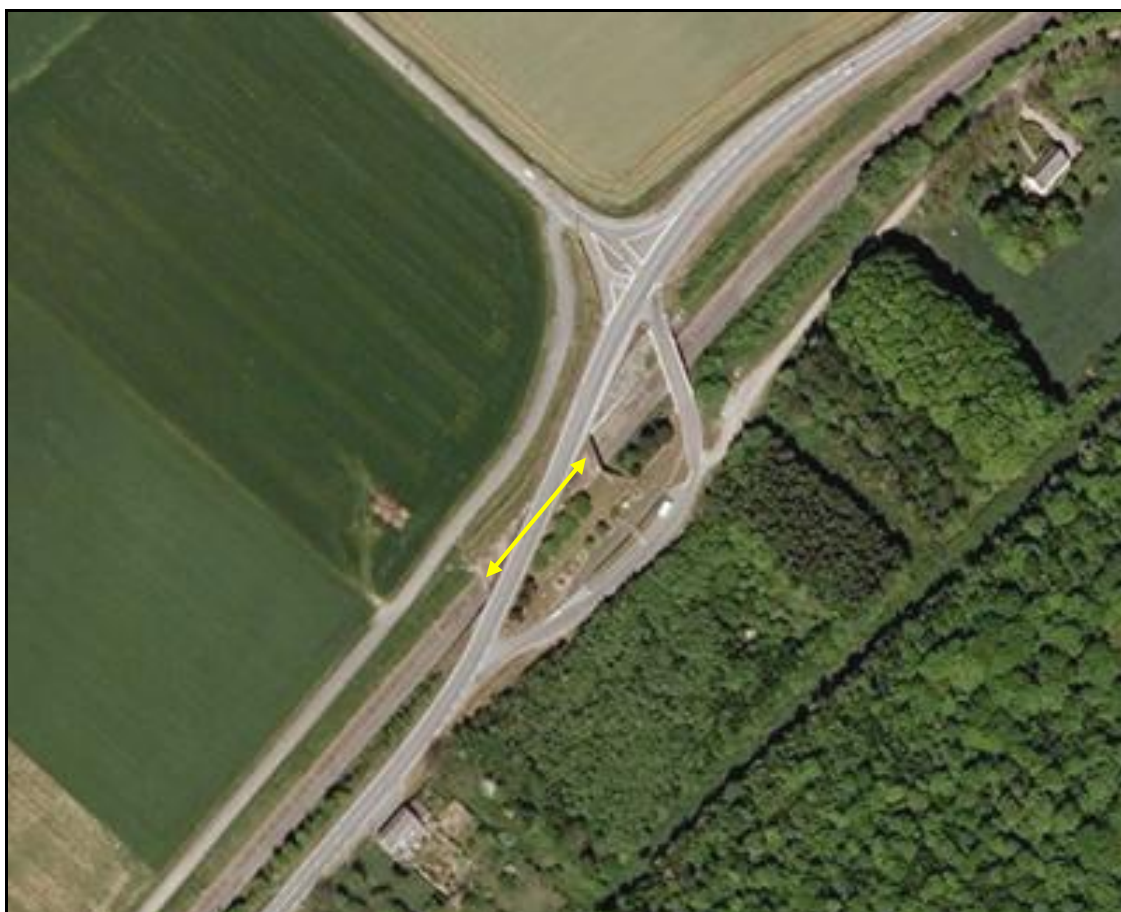
Vue aérienne de la galerie

Si cette fiche comporte des erreurs ou des oublis, merci de nous le signaler.