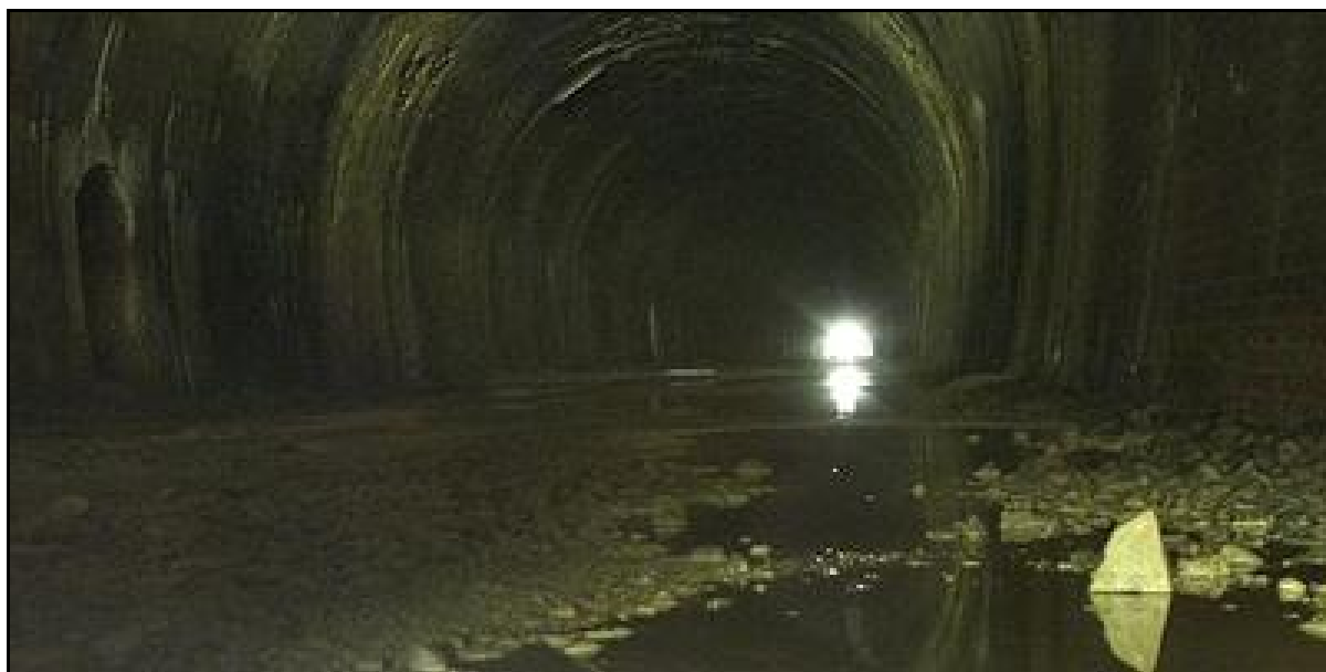
L'état de la galerie et de son radier avant qu'elle ne soit murée

Si cette fiche comporte des erreurs ou des oublis, merci de nous le signaler.