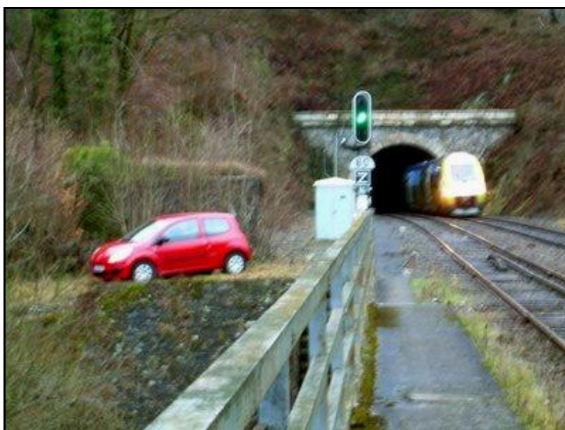
La voiture du vieil homme poussée sur le côté, juste à l'entrée du tunnel de Monthermé Un autorail sort du tunnel sur la voie que la voiture a empruntée

Plus de peur que de mal donc, mais il faudra néanmoins trois heures pour pouvoir extraire la voiture du tunnel, vérifier qu'elle n'a pas provoqué de dégâts sur la voie et autoriser à nouveau le trafic ferroviaire.