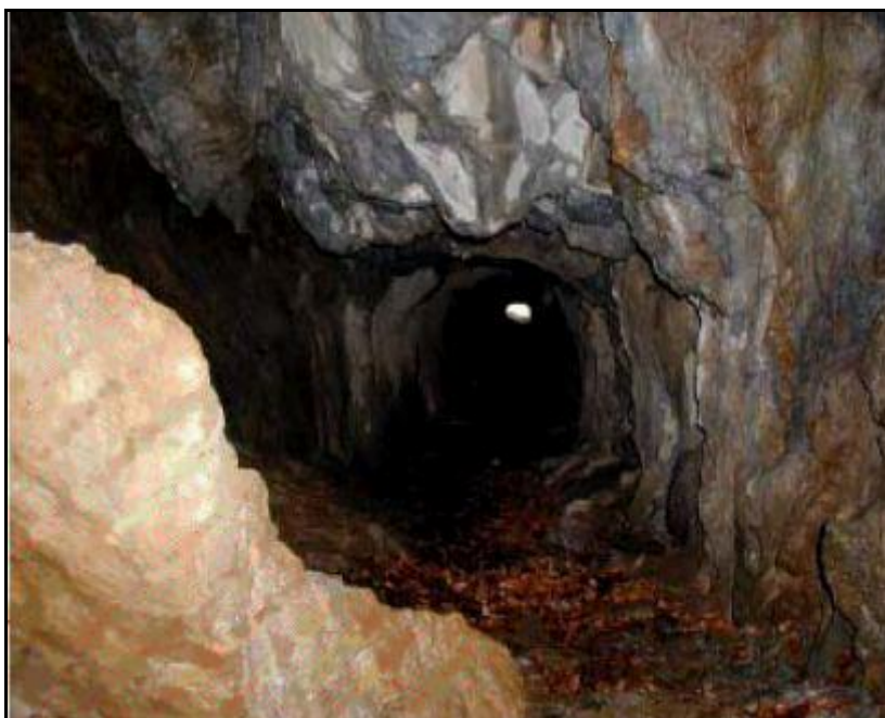
L'intérieur de la galerie Le bloc effondré au premier plan à gauche traduit bien l'état précaire du souterrain

Si cette fiche comporte des erreurs ou des oublis, merci de nous le signaler.