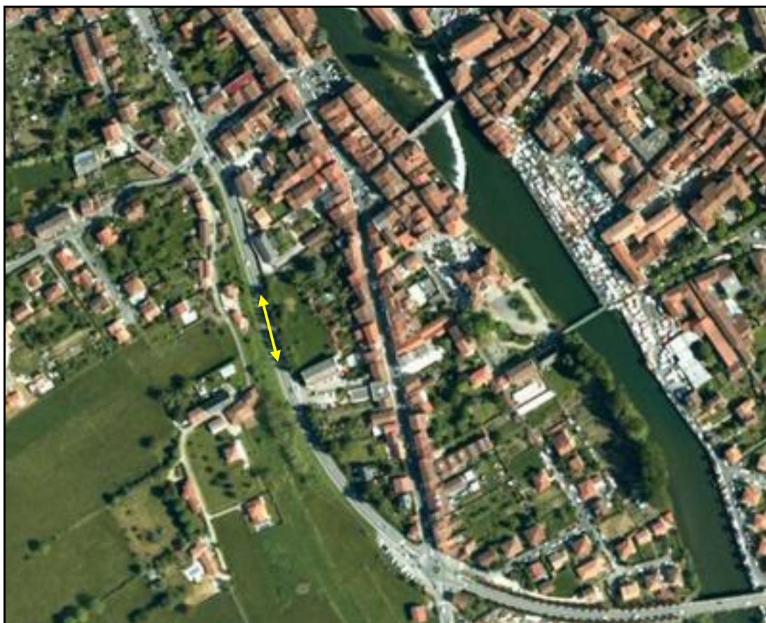
Vue aérienne de l'emplacement de la tranchée couverte aujourd'hui disparue

Si cette fiche comporte des erreurs ou des oublis, merci de nous le signaler.