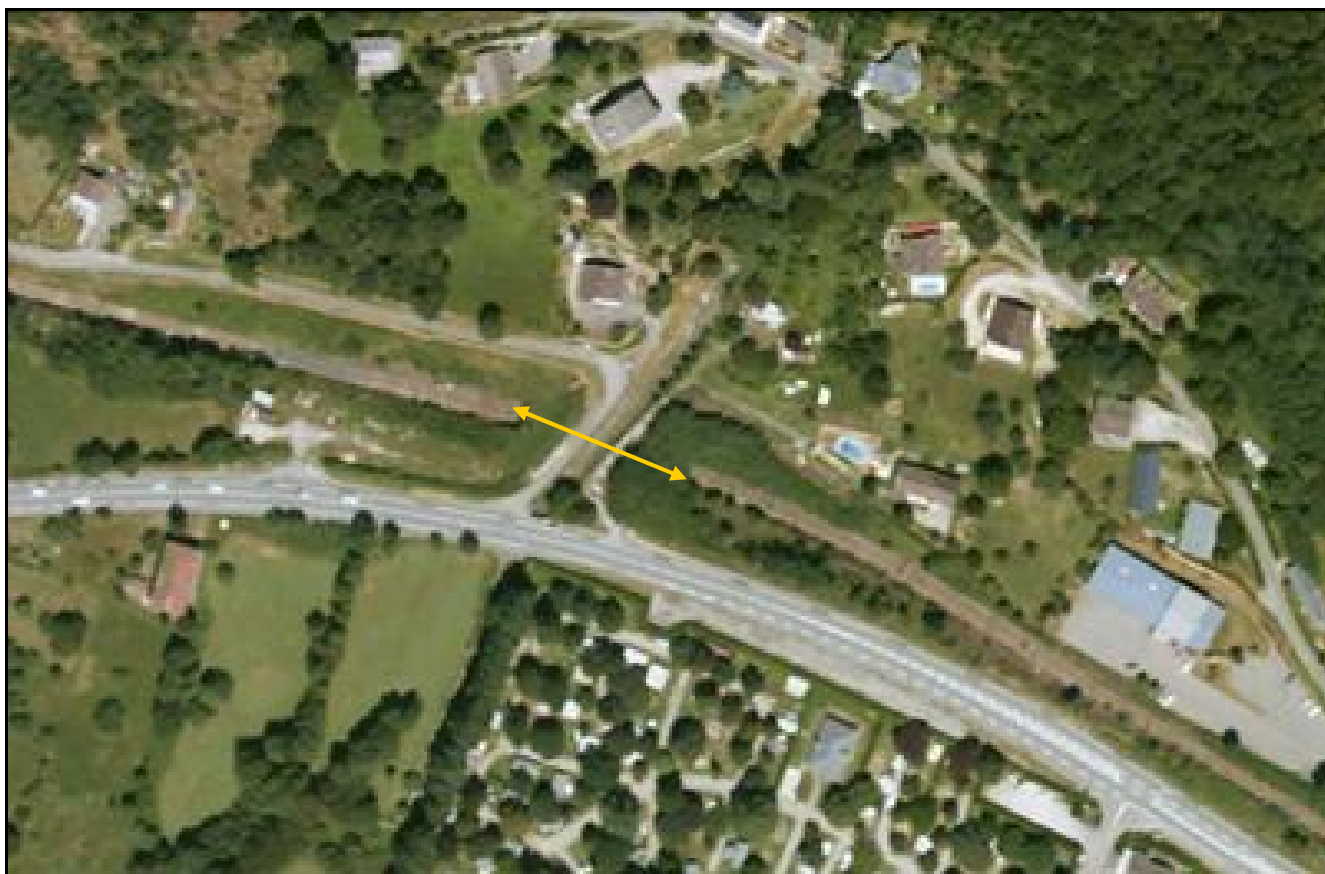
Vue aérienne de la galerie d'Eychenac Le canal du ruisseau est clairement visible sur la galerie

Si cette fiche comporte des erreurs ou des oublis, merci de nous le signaler.