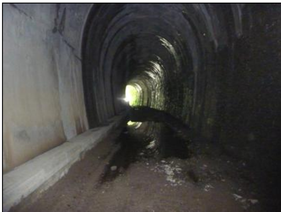
Le reflet de la voûte dans la flaque

Si cette fiche comporte des erreurs ou des oublis, merci de nous le signaler.