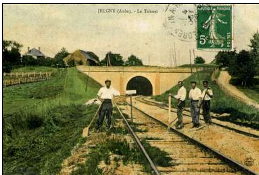
Vieille carte postale colorisée d'époque montrant une équipe de cantonniers de la voie faisant des travaux à la sortie de la tranchée couverte

Si cette fiche comporte des erreurs ou des oublis, merci de nous le signaler.