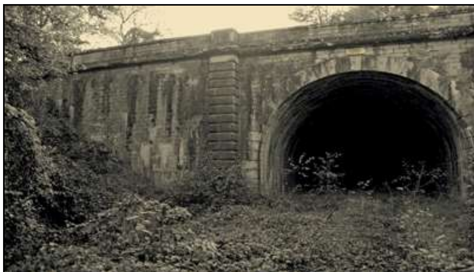
Ci-dessus et ci-dessous, deux vues de l'entrée et la sortie du tunnel abandonné après la fermeture de la ligne en 1996