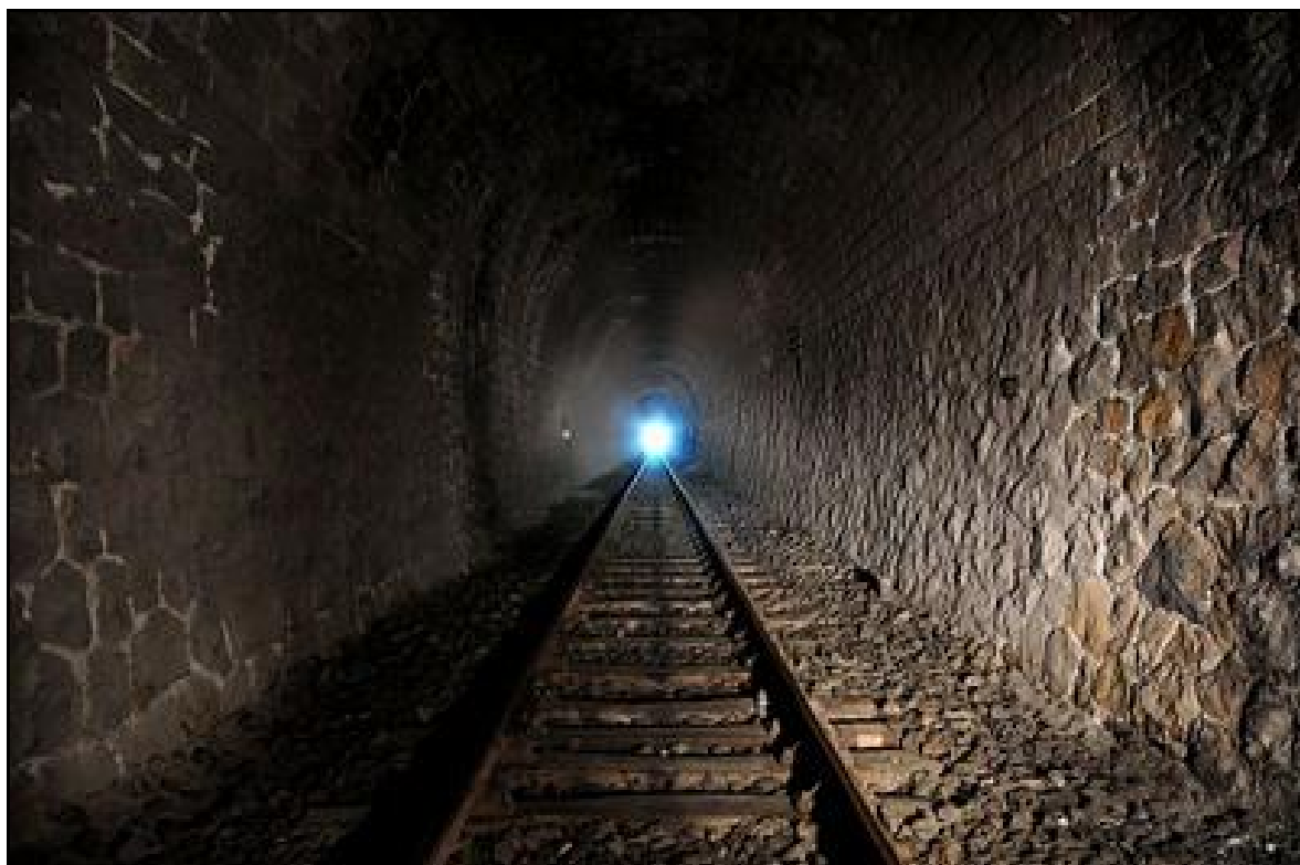
La galerie du tunnel

Si cette fiche comporte des erreurs ou des oublis, merci de nous le signaler.