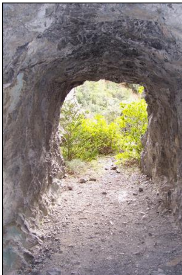
Une jolie petite galerie

Si cette fiche comporte des erreurs ou des oublis, merci de nous le signaler.