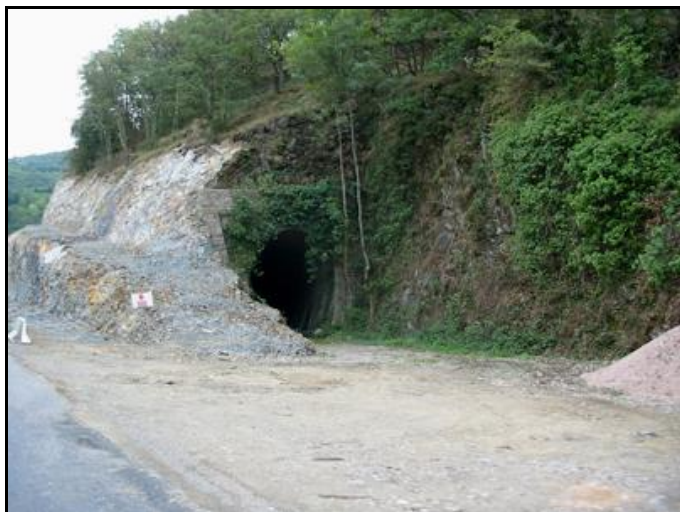
L'entrée du tunnel suite aux travaux d'élargissement de la route