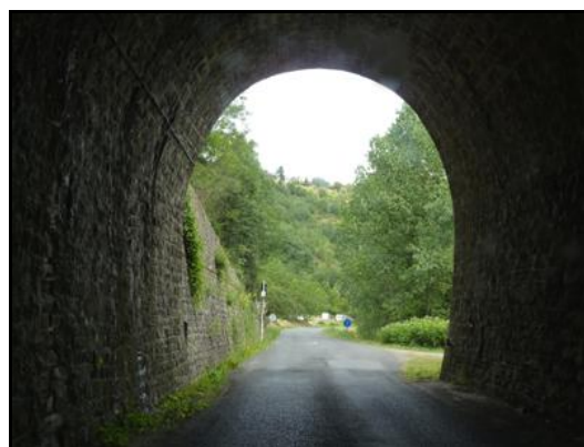
La sortie vue de l'intérieur