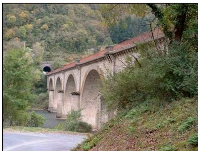
L'entrée du tunnel au bout du pont qui la précède

Si cette fiche comporte des erreurs ou des oublis, merci de nous le signaler.