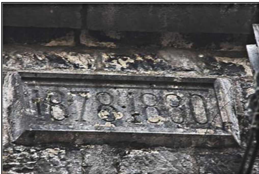
Les dates de creusement sur le fronton d'entrée du tunnel

Si cette fiche comporte des erreurs ou des oublis, merci de nous le signaler.