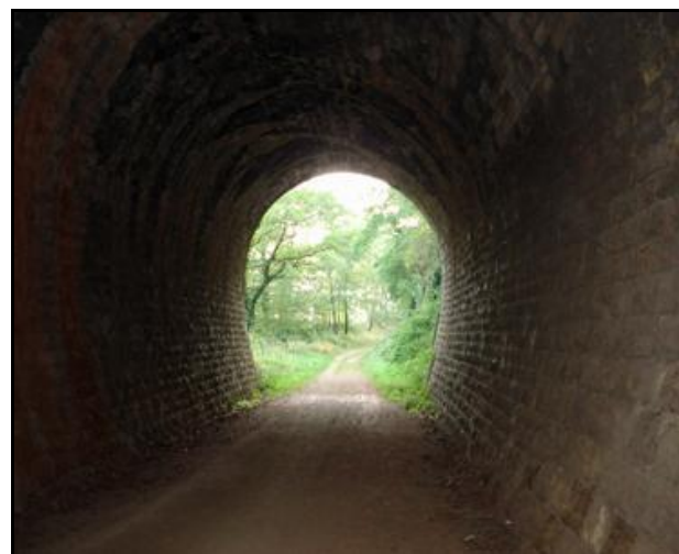
L'entrée et la sorties vues depuis la galerie