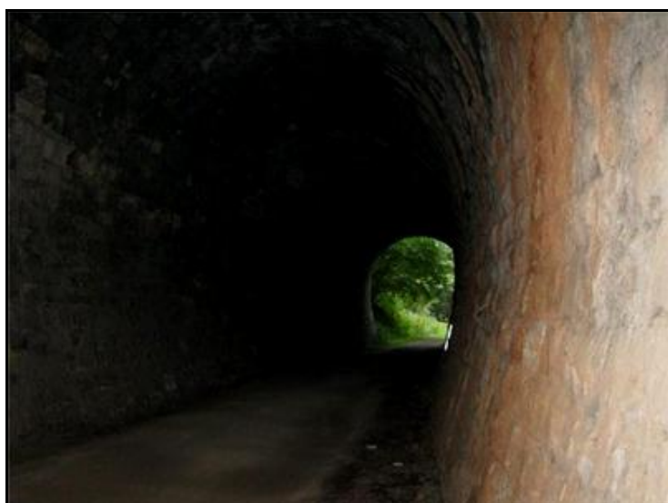
Ci-contre, gros plan sur un piédroit