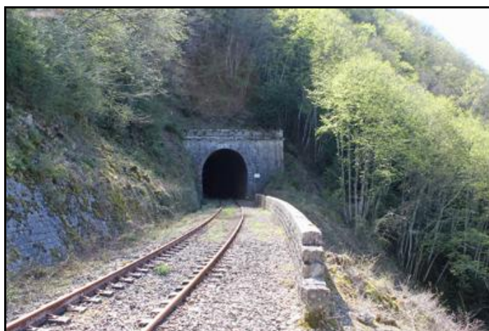
L'entrée du tunnel au bout du long viaduc qui la précède