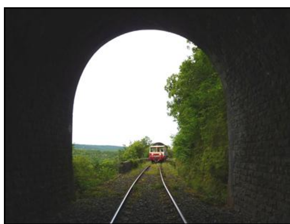
L'entrée et la sortie du tunnel vues de l'intérieur avec des éléments du train touristique en circulation