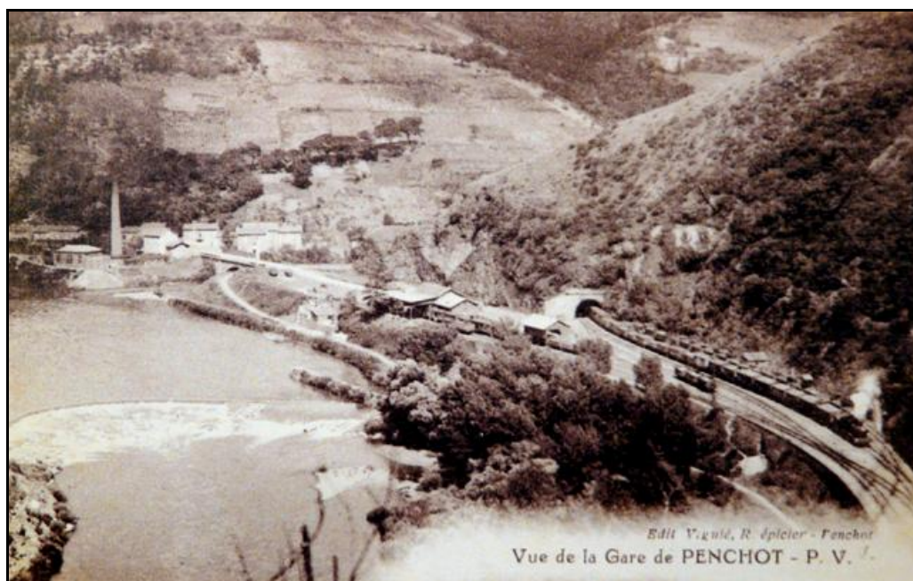
La gare de Penchot et l'entrée du tunnel

Si cette fiche comporte des erreurs ou des oublis, merci de nous le signaler.