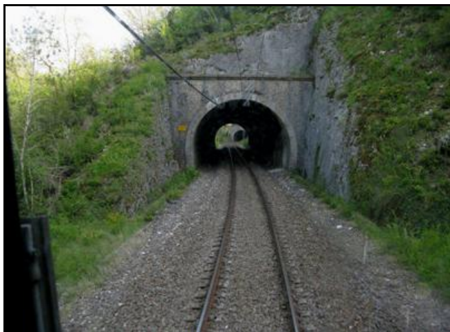
A l'arrière-plan, l'entrée du tunnel de Gaudolet