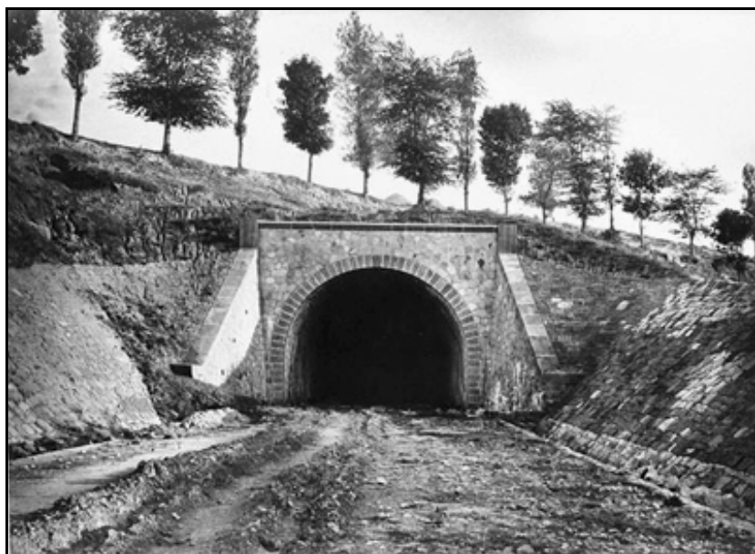
L'entrée du tunnel peu de temps après sa finition