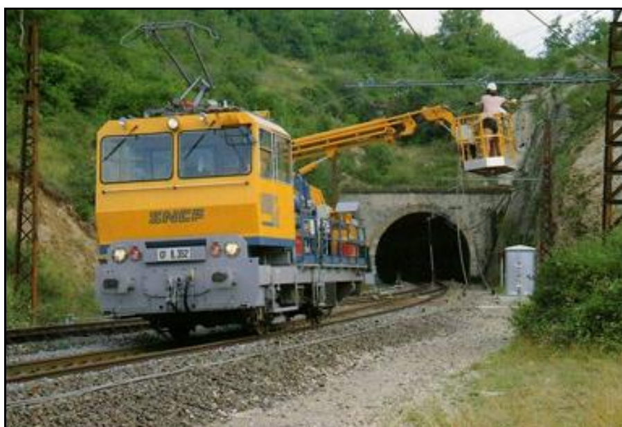
Entretien des caténaires à la sortie du tunnel