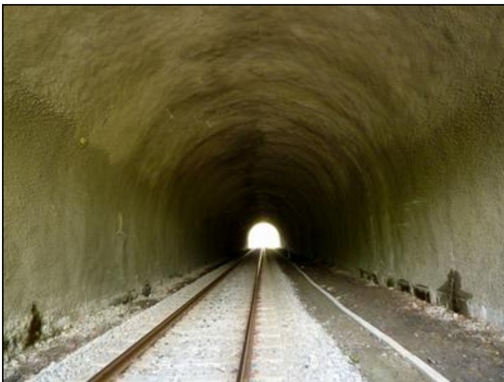
Ci-dessus et ci-dessous, la galerie du tunnel