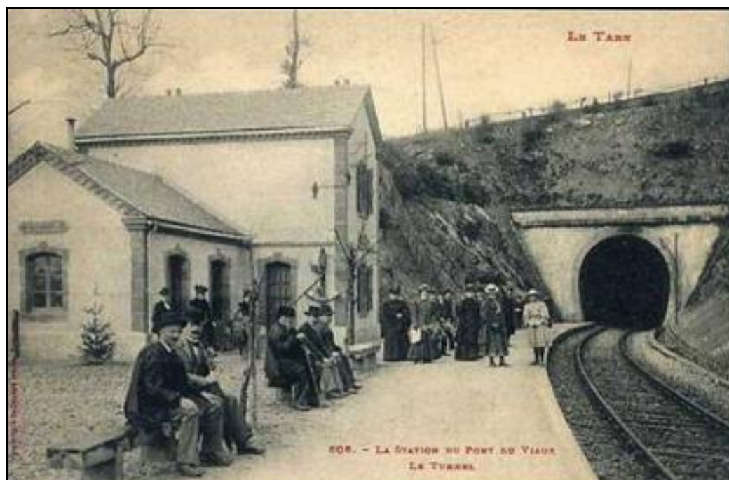
Ci-dessus et ci-dessous, deux photos anciennes datant du début du siècle dernier