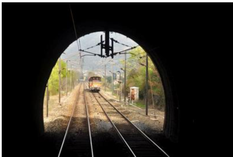
L'entrée vue de l'intérieur

Si cette fiche comporte des erreurs ou des oublis, merci de nous le signaler.