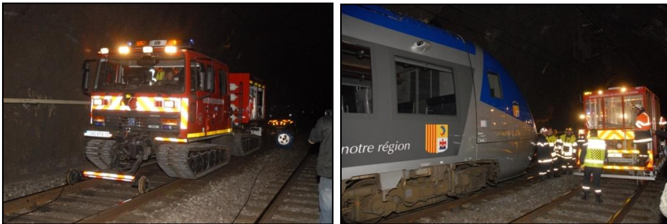
Deux photos d'un exercice de secours effectué dans le tunnel à l'aide de véhicules spéciaux

Si cette fiche comporte des erreurs ou des oublis, merci de nous le signaler.