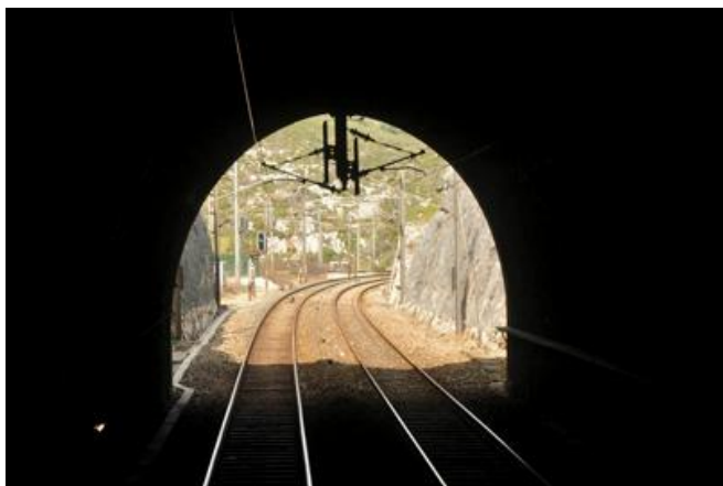
L'entrée vue de l'intérieur