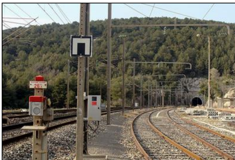
La sortie du tunnel