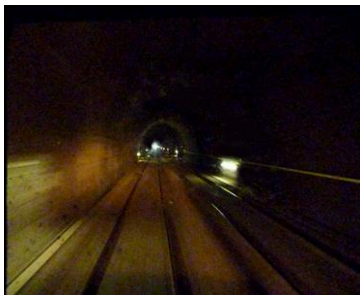
Dans la galerie