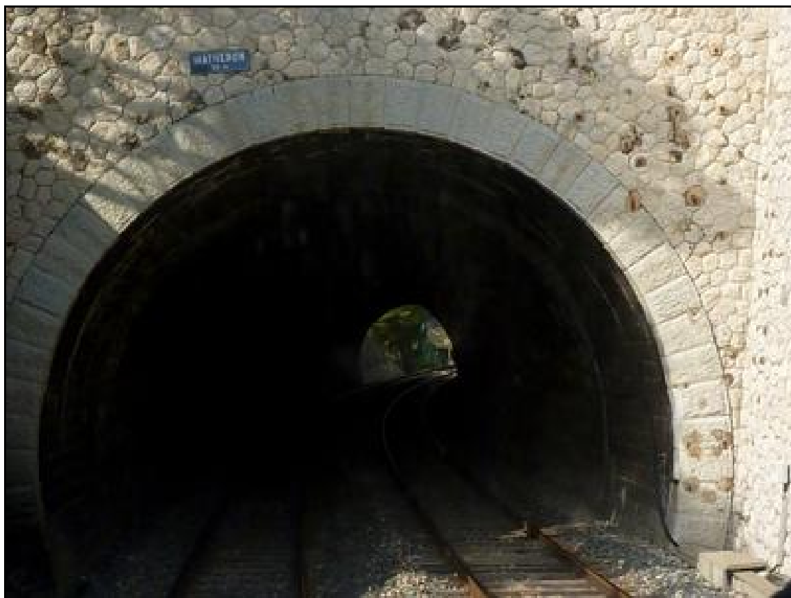
La sortie du tunnel vue depuis une locomotive

Si cette fiche comporte des erreurs ou des oublis, merci de nous le signaler.