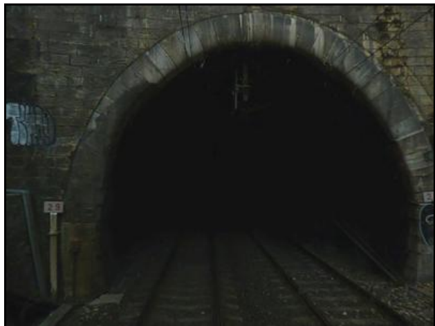
Une gueule bien noire