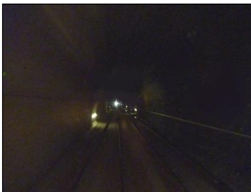
Ce que l'on voit de la galerie à 100 km/h en conduisant un train

Si cette fiche comporte des erreurs ou des oublis, merci de nous le signaler.