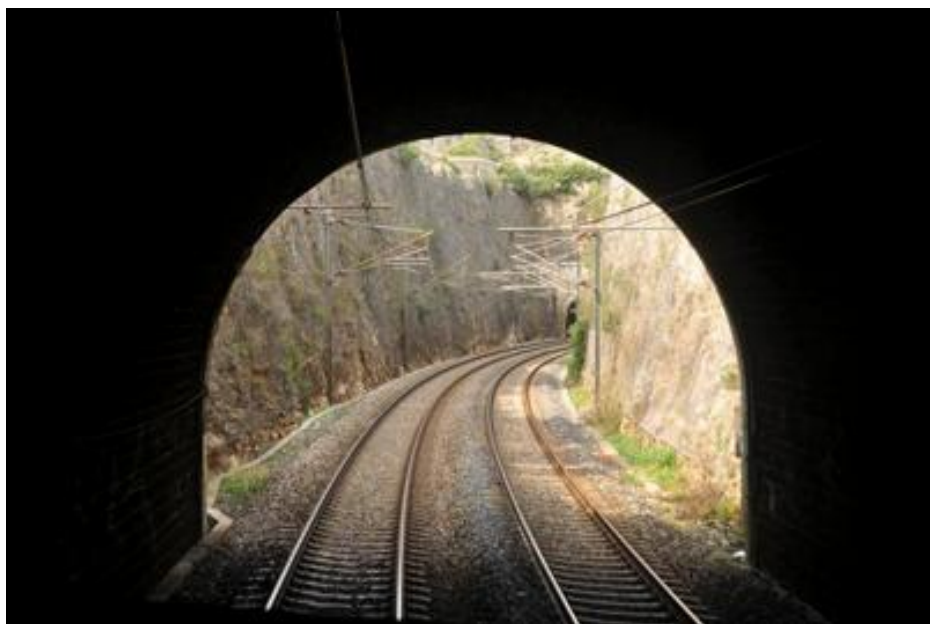
L'entrée de la galerie de la Bécasse vue de l'intérieur avec, au fond de la tranchée, la sortie du tunnel des Janots

Si cette fiche comporte des erreurs ou des oublis, merci de nous le signaler.