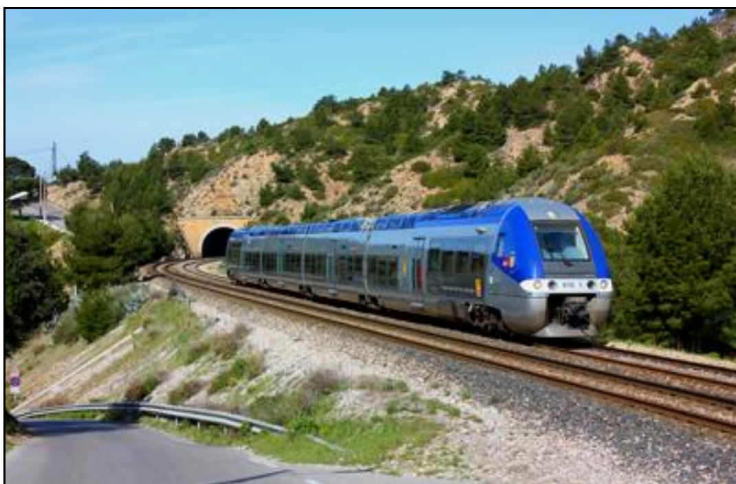
Un AGC bimode sort du tunnel de l'Anthénor 1

Si cette fiche comporte des erreurs ou des oublis, merci de nous le signaler.