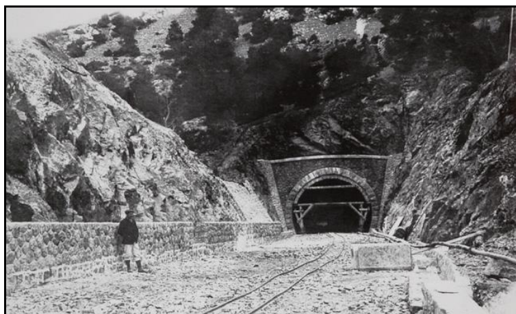
Ci-contre, l'entrée du tunnel au moment de sa construction

Si cette fiche comporte des erreurs ou des oublis, merci de nous le signaler.