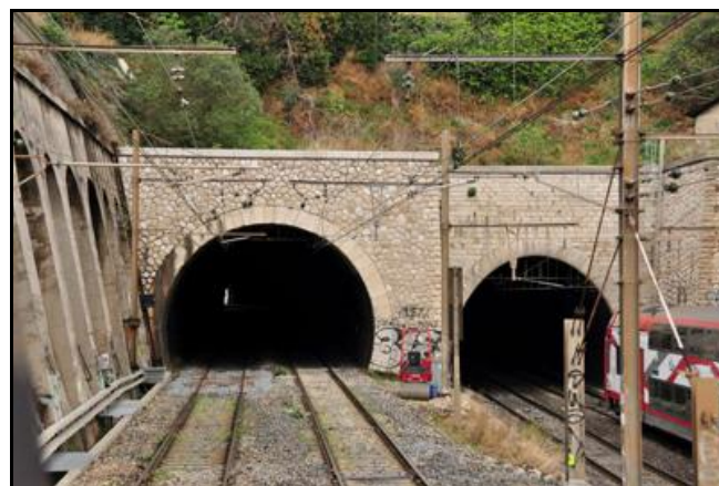
Sortie du tunnel de Saint Charles Sud à gauche Sortie du tunnel de Saint Charles Nord à droite