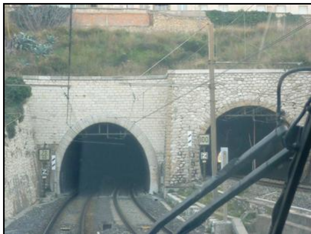
Le tunnel de Saint Charles Nord est ici à gauche Celui de Saint Charles Sud est à droite