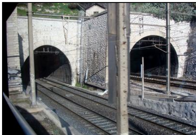
Sorties des tunnels des Chartreux à droite et de Saint Charles Nord à gauche