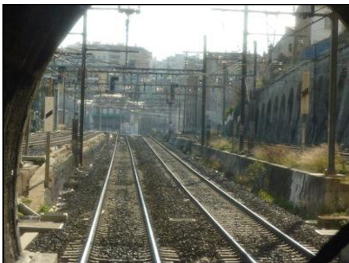
La sortie du tunnel vue de l'intérieur

Si cette fiche comporte des erreurs ou des oublis, merci de nous le signaler.