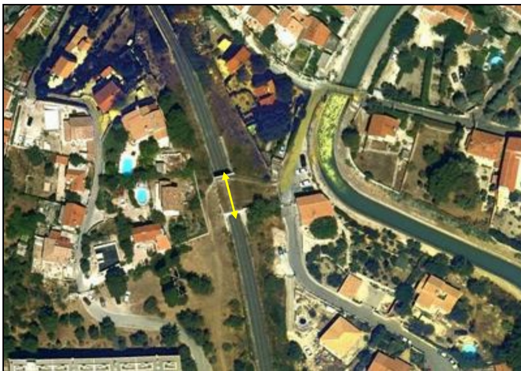
Vue aérienne de la galerie

Si cette fiche comporte des erreurs ou des oublis, merci de nous le signaler.