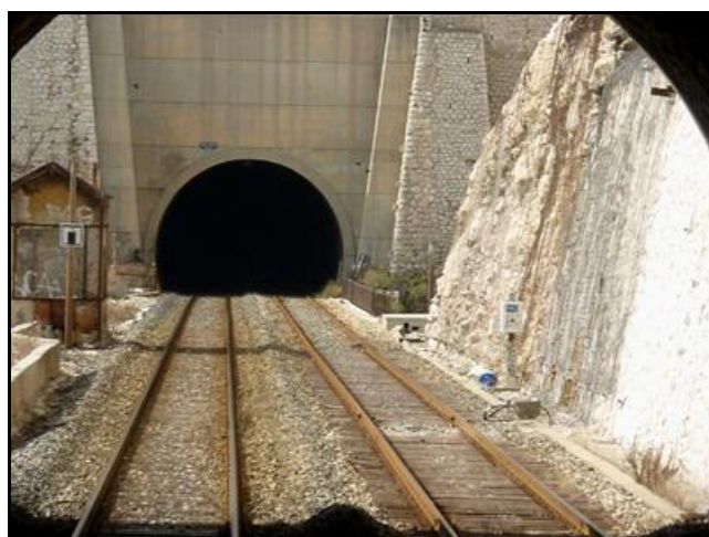
La sortie du tunnel de Rio Tinto vue depuis l'entrée du tunnel des Riaux