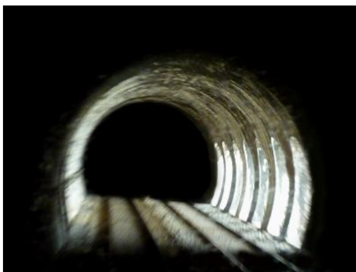
Ci-dessus et ci-dessous, vue extérieure et intérieure des fenêtres de la galerie de l'Assiette qui relie les tunnels ferroviaires de Rio Tinto (à gauche) et de Caudelette (à droite) et domine la sortie du canal souterrain du Rove

Si cette fiche comporte des erreurs ou des oublis, merci de nous le signaler.