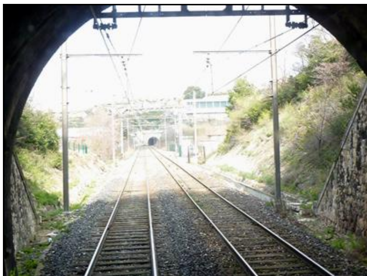
L'entrée du tunnel vue de l'intérieur avec, au fond, la sortie du tunnel de Consolat

Si cette fiche comporte des erreurs ou des oublis, merci de nous le signaler.