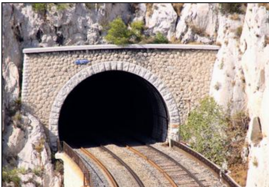
Gros plan sur la sortie du tunnel

Si cette fiche comporte des erreurs ou des oublis, merci de nous le signaler.