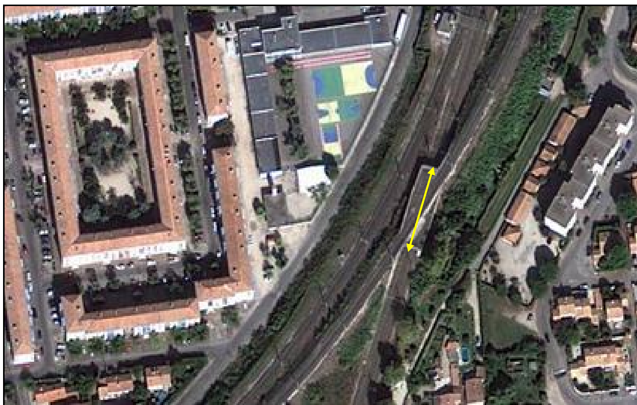
Vue aérienne du saut de mouton de Tarascon

Si cette fiche comporte des erreurs ou des oublis, merci de nous le signaler.