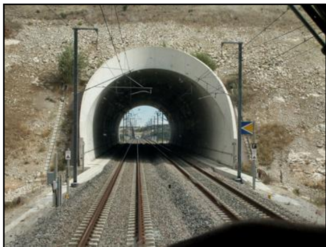
Tout au fond, l'entrée du tunnel de Lambesc