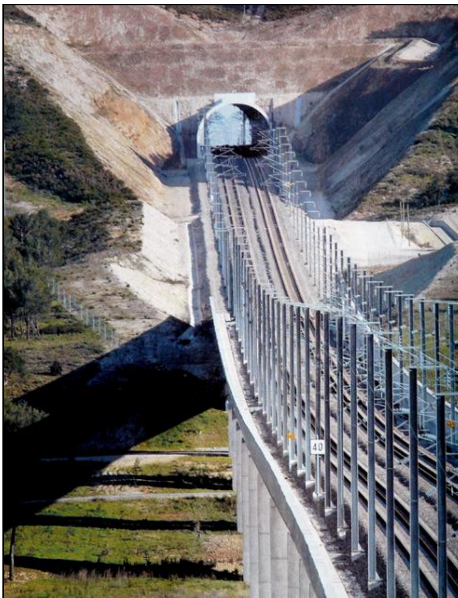
Au-delà du viaduc de l'Héritière, l'entrée du tunnel

Si cette fiche comporte des erreurs ou des oublis, merci de nous le signaler.