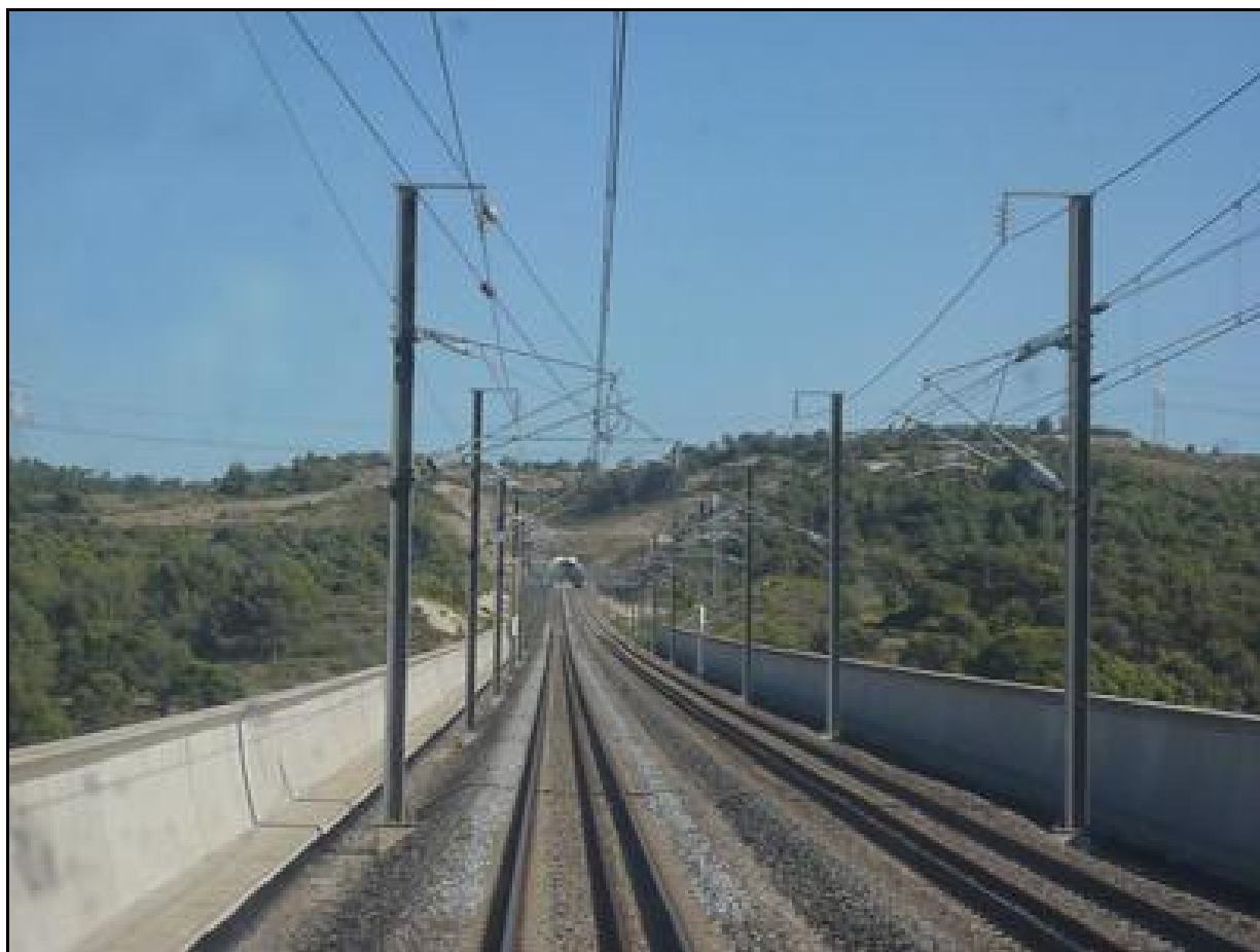
Ci-dessus et ci-dessous, le viaduc de l'Héritière et l'entrée du tunnel dans le fond