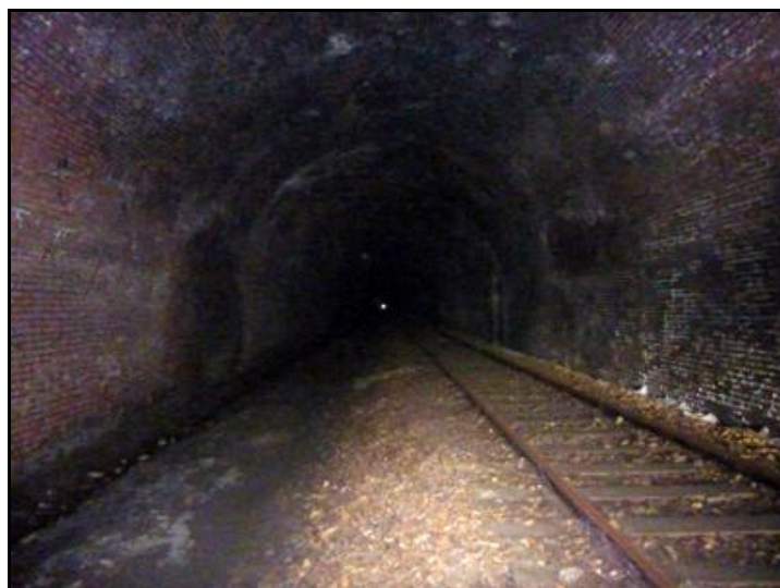
Le tunnel offre une galerie particulièrement sombre