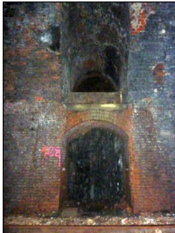
Ci-dessus et ci-dessous, débouchés des deux cheminées d'aération dans la galerie Chaque cheminée débouche par deux orifices : une niche inférieure et un orifice supérieur situé à la naissance de la voûte