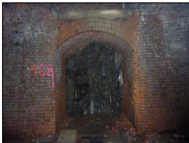
Ci-dessus et ci-dessous, détail des orifices des cheminées d'aération