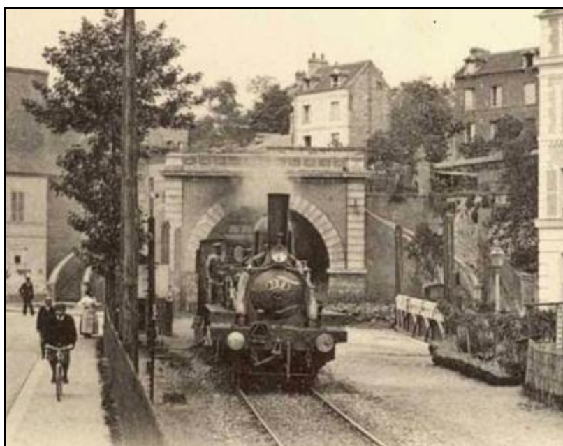
L'entrée de la galerie à l'époque de la vapeur et du temps où la ligne était d'abord à voie unique