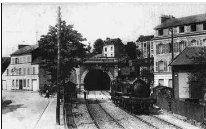
Puis, ci-dessus et ci-dessous, à l'époque où la ligne était en voie double avant de redevenir beaucoup plus tard en voie unique faute de trafic suffisant