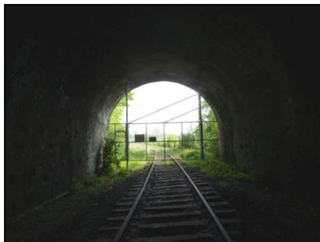
Ci-dessus et ci-dessous, divers aspects de la galerie