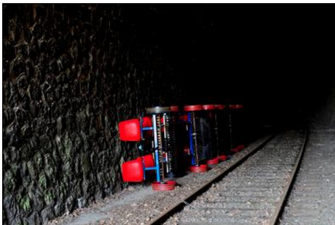
Rangées dans la galerie, quelques vélorails d'une association voisine

Si cette fiche comporte des erreurs ou des oublis, merci de nous le signaler.