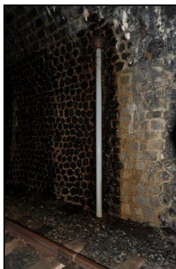
Dans la galerie, une belle source ferrugineuse et un drain de captage mural