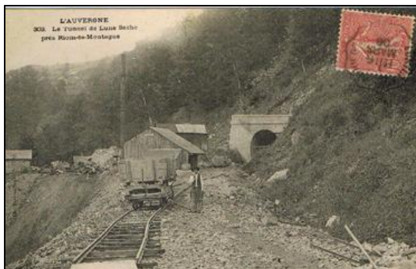
Ci-dessus et ci-dessous, l'entrée et la sortie du tunnel au temps de sa construction Sur la photo ci-dessous, remarquer le plan incliné (flèche) destiné à amener les matériaux du chantier