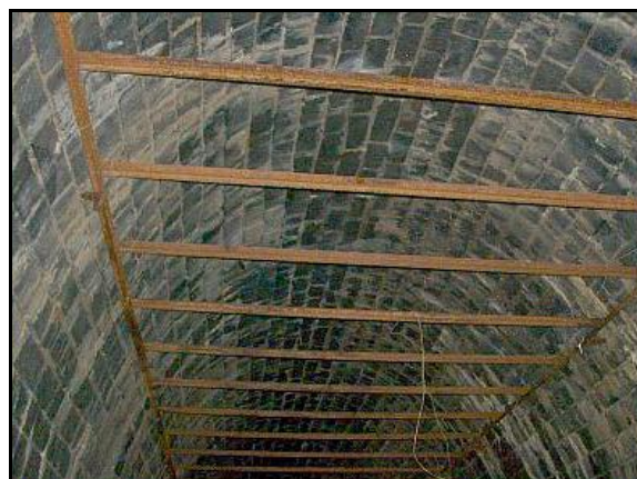
Détails des anciennes installations et des restes du faux plafond de la fromagerie