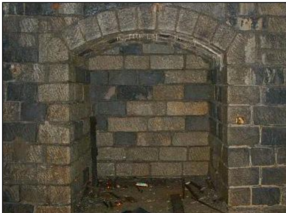
L'une des belles niches du tunnel

Si cette fiche comporte des erreurs ou des oublis, merci de nous le signaler.