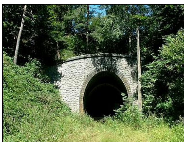
L'entrée enfouie dans la verdure

Ci-contre et ci-dessous, deux photos de la sortie du tunnel vue depuis l'ancienne gare de Chabrillac