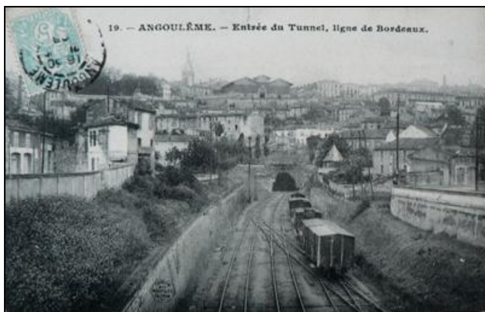
Ci-dessus et ci-dessous, l'entrée du tunnel, du temps de la vapeur