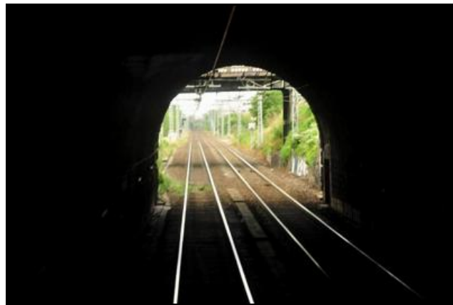
L'entrée et la sortie du tunnel vues de l'intérieur