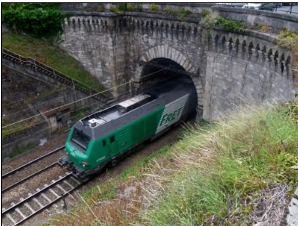
Un train de fret à la sortie du tunnel

Si cette fiche comporte des erreurs ou des oublis, merci de nous le signaler.