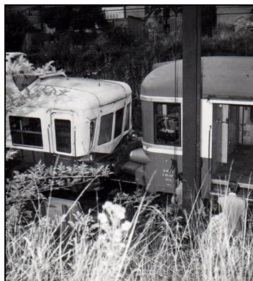
L'entrée du tunnel avec, à l'avant, l'autorail Picasso et sa cabine de conduite si particulière, et à l'arrière, l'autorail Caravelle tamponneur