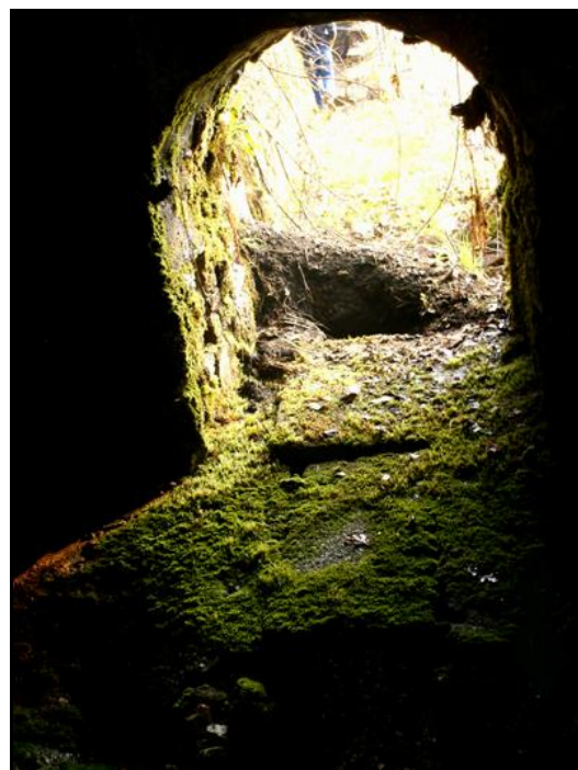
L'intérieur du drain qui montre bien l'important volume des eaux d'infiltration