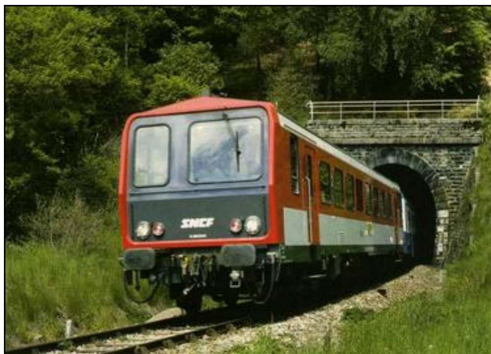
Un autorail à destination de Meymac entre dans le tunnel

Si cette fiche comporte des erreurs ou des oublis, merci de nous le signaler.