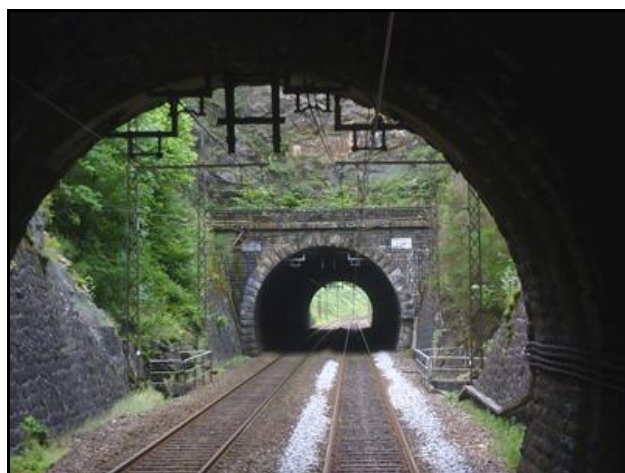
La sortie du tunnel et l'entrée de Theil n° 2 en suivant