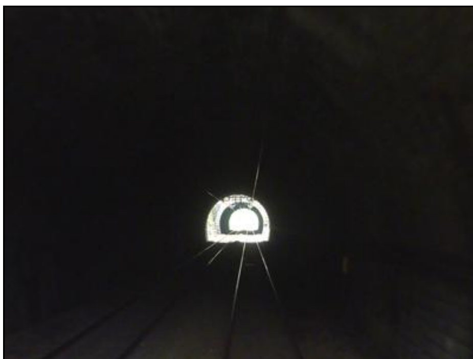
Dans la galerie avec le tunnel de Theil n° 2 en suivant

Si cette fiche comporte des erreurs ou des oublis, merci de nous le signaler.