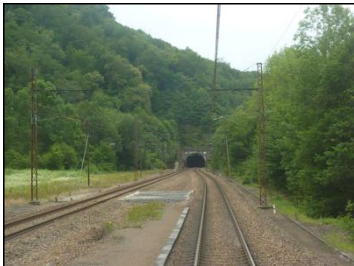
Au premier plan, le quai de la gare d'Estivaux