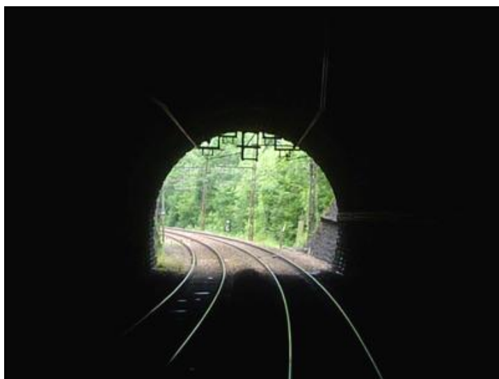
La sortie vue de l'intérieur

Si cette fiche comporte des erreurs ou des oublis, merci de nous le signaler.