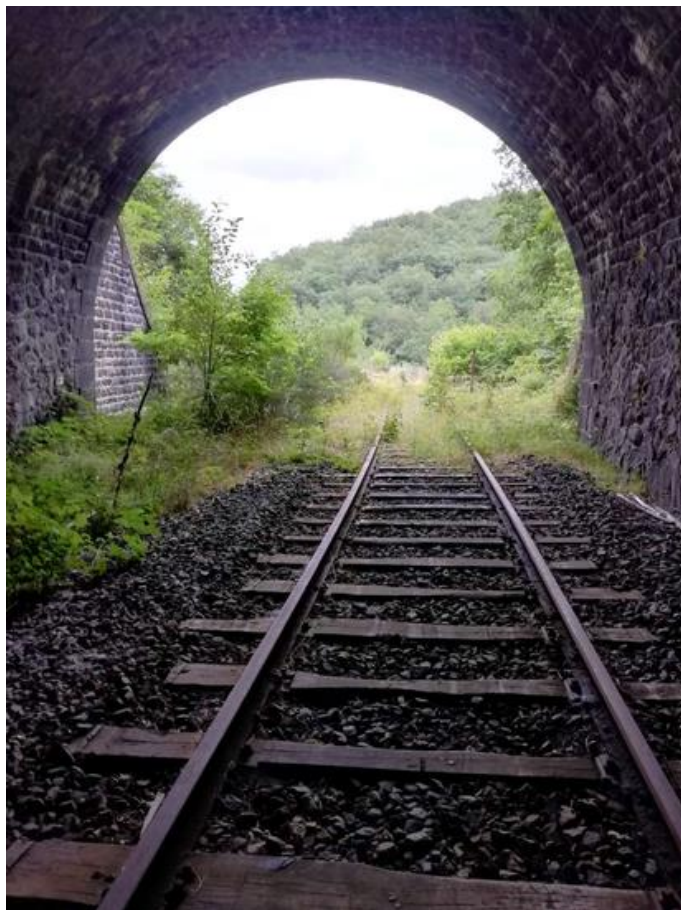
Vue de la sortie depuis l'intérieur du tunnel (03/09/2021)