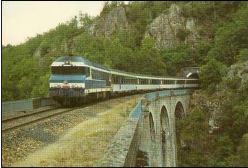
La sortie du tunnel suivie du viaduc sur le Chavanon