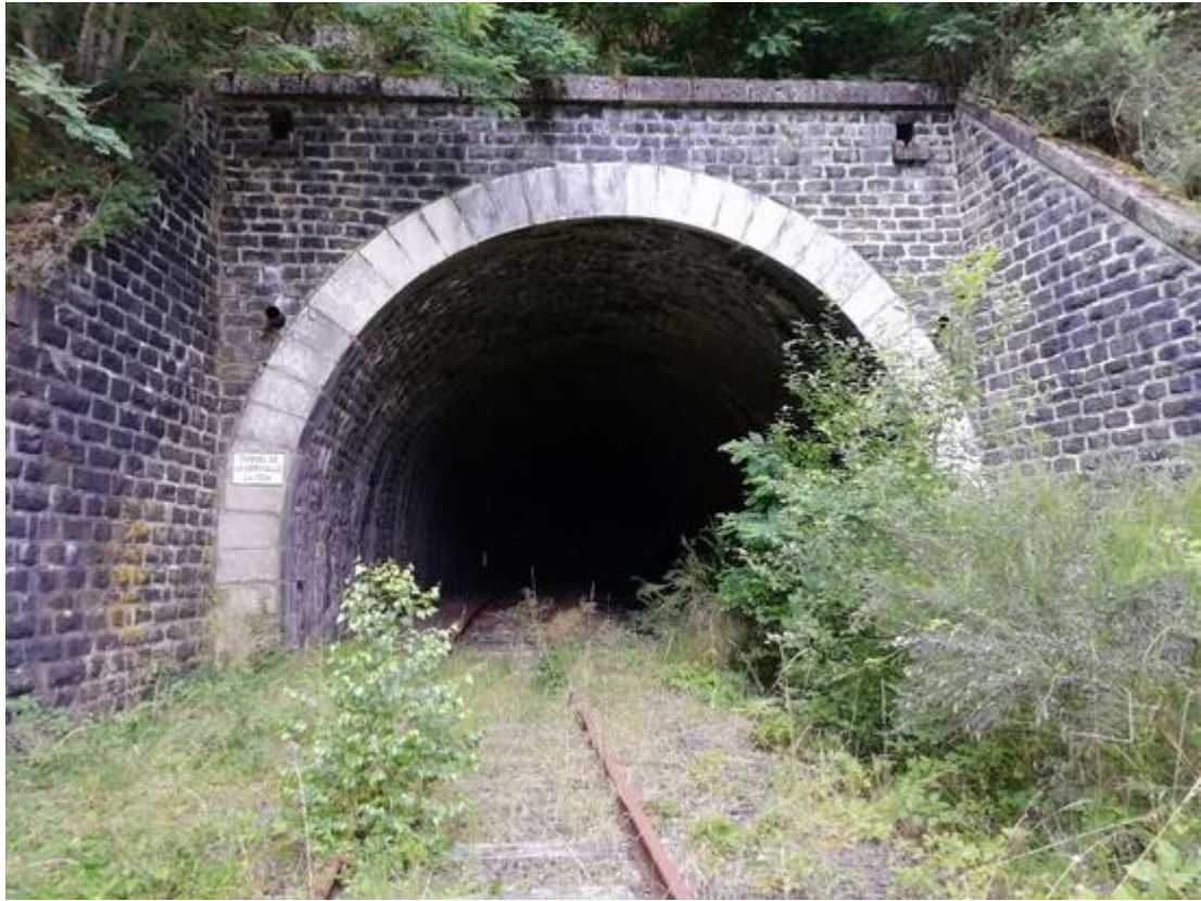
Sortie après la fermeture de la ligne (03/09/2021)