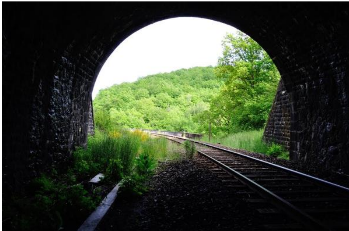
Vue de la sortie depuis l'intérieur du tunnel (15/06/2013)