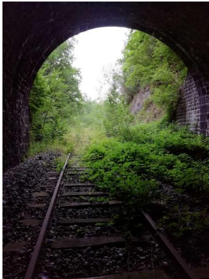
Vue de l'entrée depuis l'intérieur du tunnel (03/09/2021)