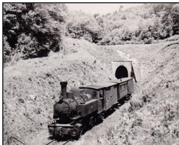
La sortie du tunnel du temps du petit train

Si cette fiche comporte des erreurs ou des oublis, merci de nous le signaler.