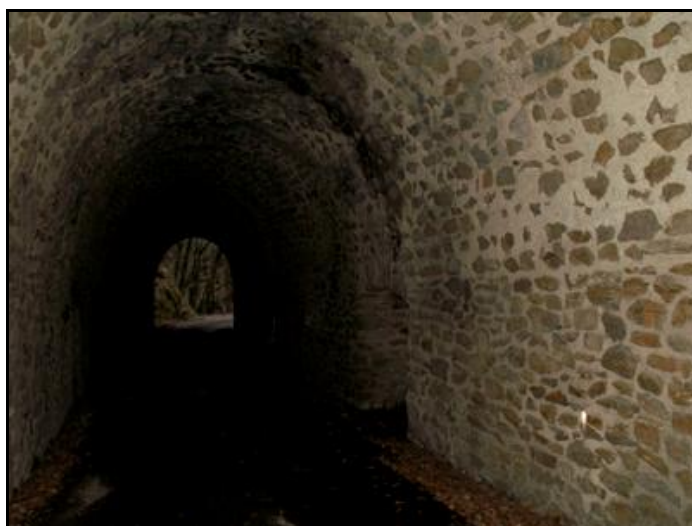
Et l'intérieur de la galerie

Si cette fiche comporte des erreurs ou des oublis, merci de nous le signaler.